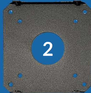
Element mocowany do urządzenia Wymiary: 123,4 x 120 x 10,5 mm